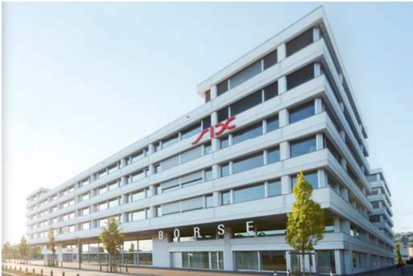
SIX, ConventionPoint, Zürich