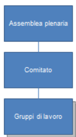
Figura 2: Struttura organizzativa

La Società semplice Terravis è organizzata nel seguente modo